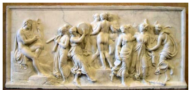
Danse des Muses sur le mont Hélicon - 1807