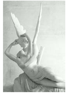
Cupidon et psyché 1800-03