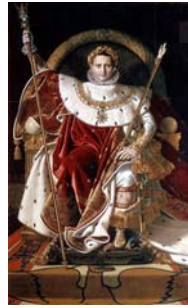
Napoléon 1er sur le trône impérial 1806 - 2,59x1,62m